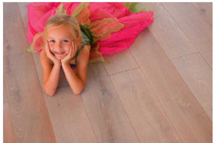
Die kleine Prinzessin fühlt sich sichtlich wohl auf den HOCOstyle-Eichendielen Opal mit gebürsteter und gefaseter Oberfläche, oxidativ geölt