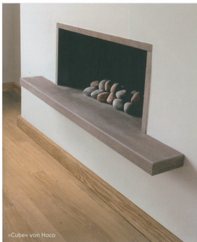
»Cube« von Hoco

Die Leistenserie »Cube« gehört mittlerweile zum festen Bestandteil und erfreut sich nicht nur bei den Anhängern des Bauhaus-Stils grosser Beliebtheit. Die reduzierten Formen überzeugen durch ihr markantes, kantiges Profil und sind in vier unterschiedlichen Breiten erhältlich. Zeitgemässe Farbvarianten, von Edelholzfurnieren über RAL-Lackierungen bis hin zu Edelstahl-oberflächen führen dazu, dass sich diese besonders für viele Kunst- und Interior-Trends einsetzen lassen. Gerade bei Sonderwünschen oder Spezialanfertigungen zeigt sich die Kompetenz der Hoco-Produktionsfachkräfte, die mit dem eigenem Werkzeugbau nahezu jeden individuellen Wunsch erfüllen können. ■